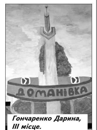
Гончаренко Дарина, III місце.