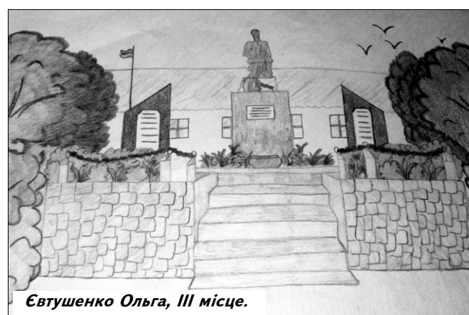
Євтушенко Ольга, III місце.