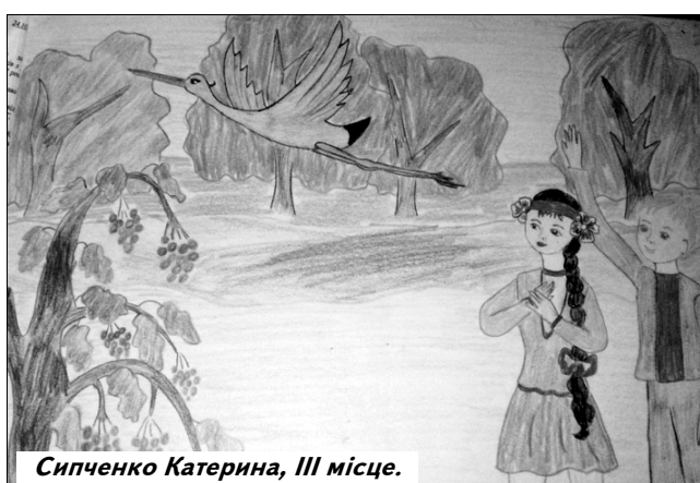
Сипченко Катерина, III місце.